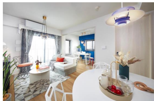
棟内モデルルーム(竣工済)