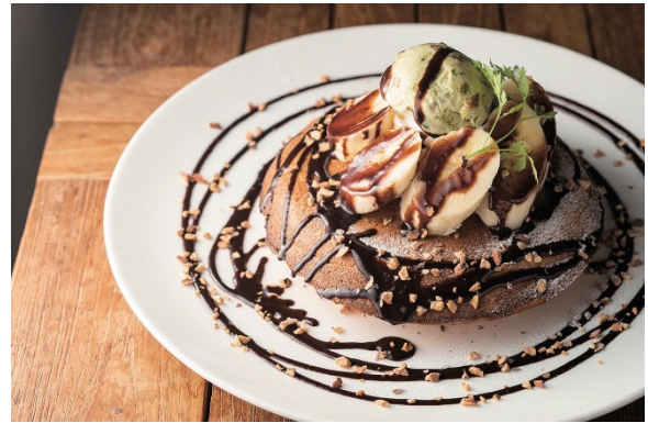
自家製パンケーキ