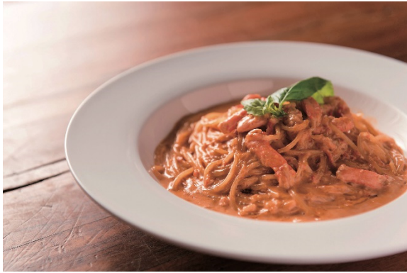
ズワイガニとかにみそのトマトクリームパスタ