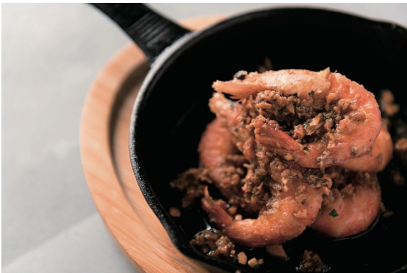
ガーリックシュリンプ