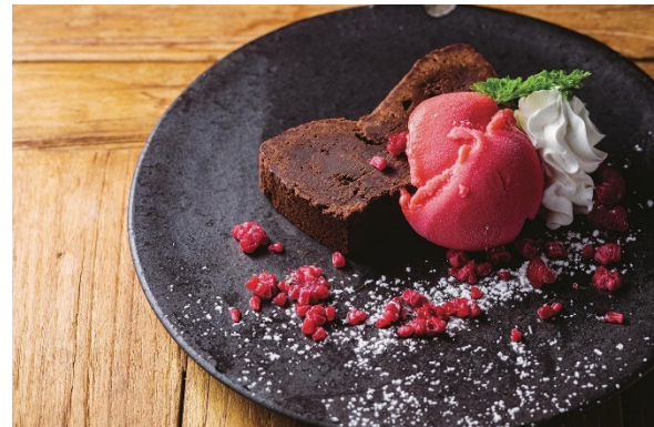
ガトーショコラ ~フランボワーズシャーベット添え~