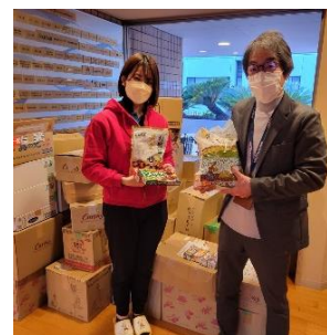
〈③最寄り施設へお届け〉