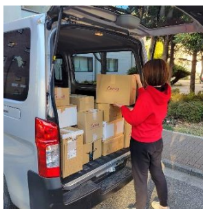
〈②仕分け・梱包、運搬〉