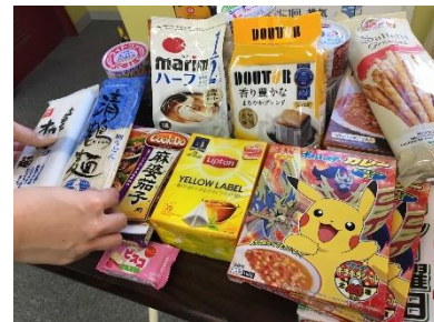
<前回のフードドライブ実施風景>

全国各店で集められた食品は、それぞれの店舗のある地域の福祉施設や団体といった地域の方にとって身近なところに、カーブスのコーチが直接お届けしています。これまで 15 回の実施において、参加人数は累計約 178 万人、累計約 2,478 トンの食品が集まっています。