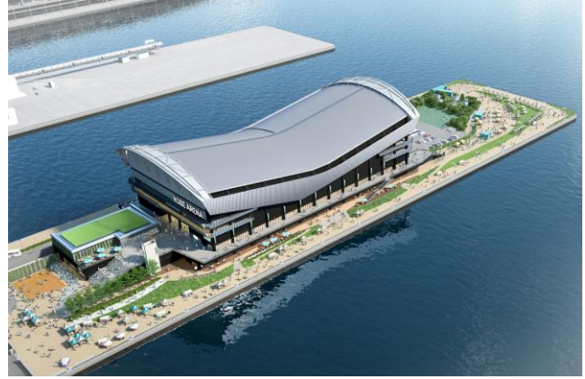
(「神戸アリーナ (仮称)」鳥瞰イメージ)