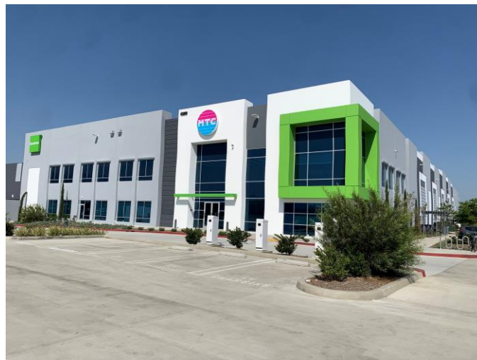
【ミューチャルトレーディング社 本社外観】