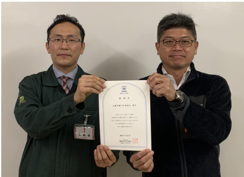
当社代表取締役社長岩崎（右）と 代表店舗として TOP 南柏店店長（左）