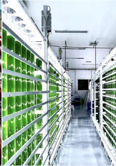
Evergen 社の藻類研究施設