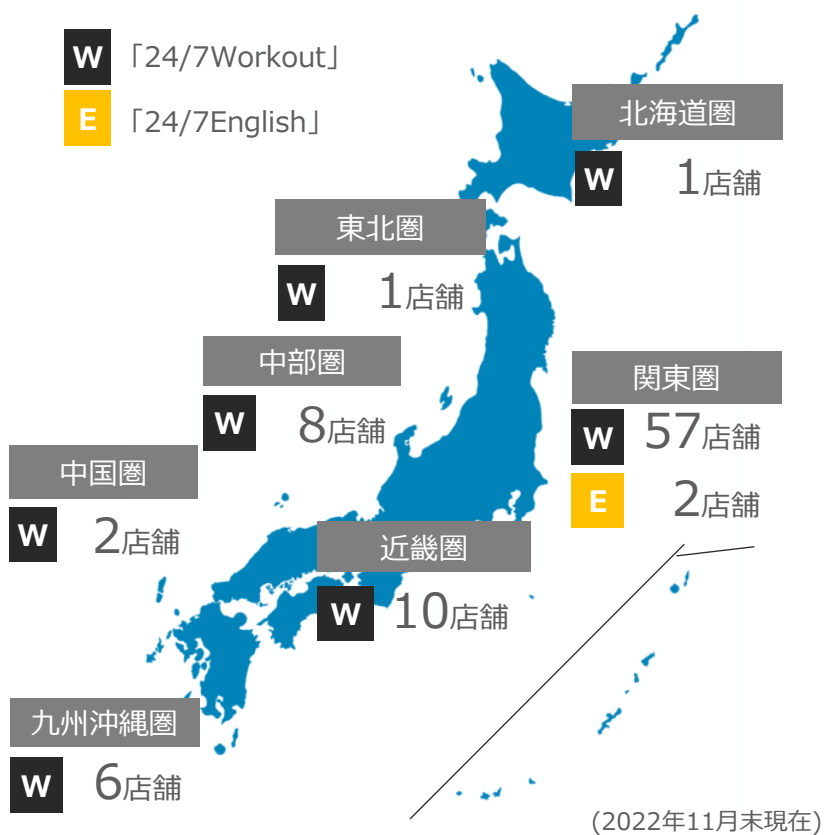
現在の地域別国内店舗網