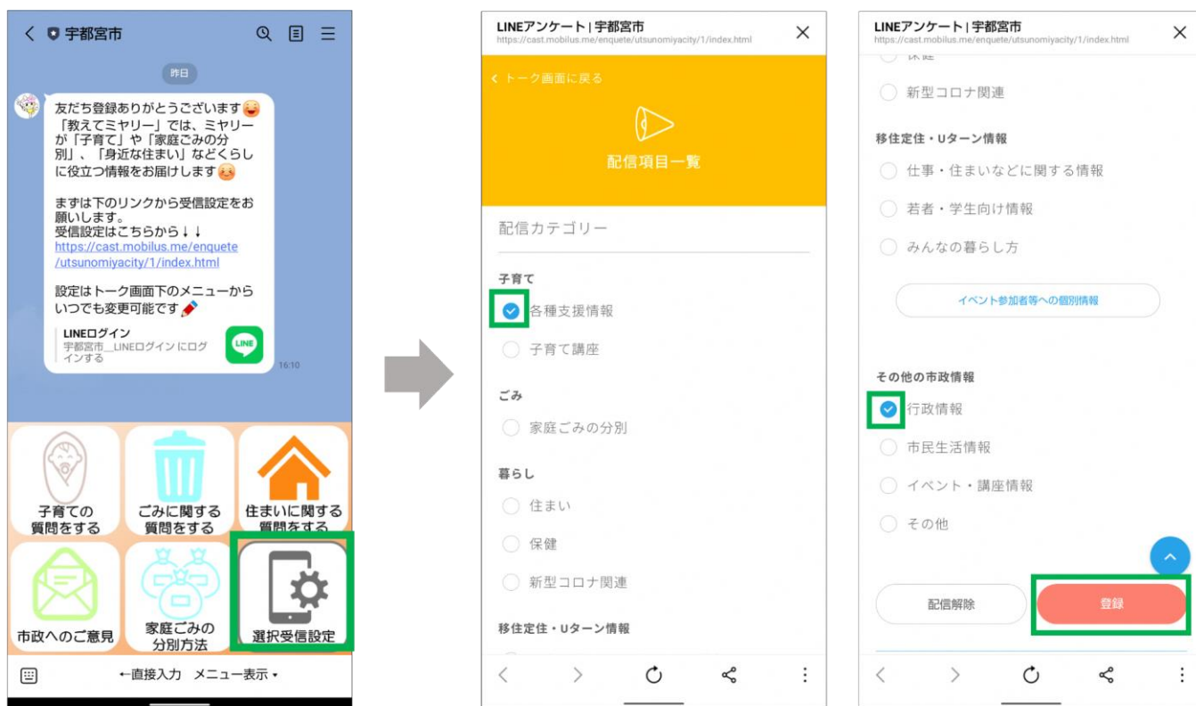
図3 「選択受信設定」の設定方法