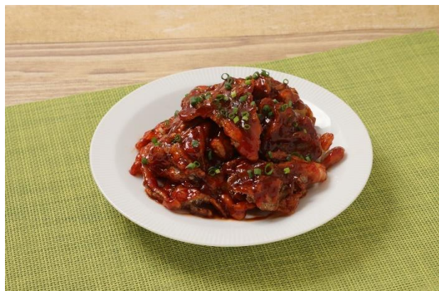
ヤンニョムまいたけ

京都産業大学経営学部松本ゼミナールの学生の皆様からまいたけレシピを多数考案いただき、厳正なる審査の結果、以下のレシピが本企画に採用となりました。