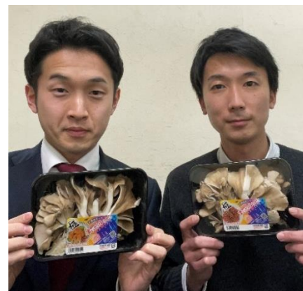
当社担当者・平和堂担当者様