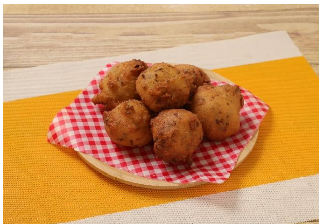
まいたけドーナツ