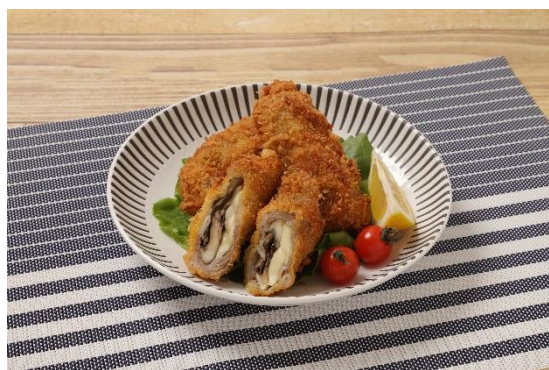
まいたけフライチーズ

レシピのポイント；意外な組み合わせですが美味しい！おやつで手軽に野菜も取れます。