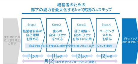
経営者のための部下の能力を最大化する1on1実践の4ステップ [step.4] コーチングスキルを学ぶ