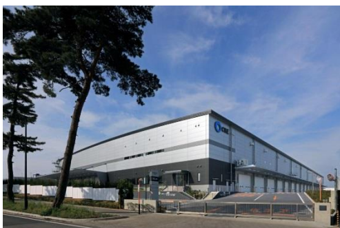
9 ロジスクエア守谷 2017年5月竣工