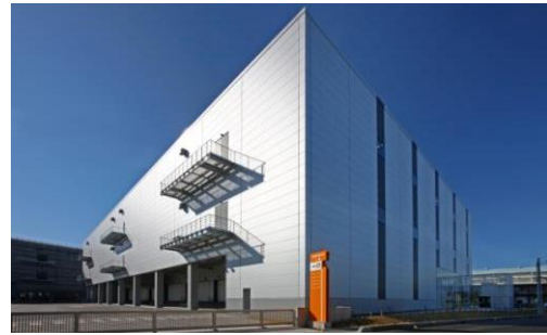
2 ロジスクエア八潮 2014年1月竣工