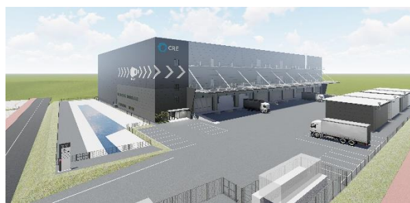
27 ロジスクエア福岡小郡 2024年2月竣工予定