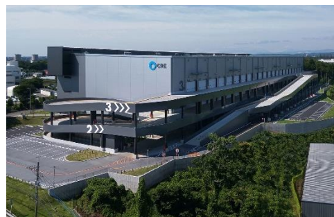
18 ロジスクエア狭山日高 2020年6月竣工