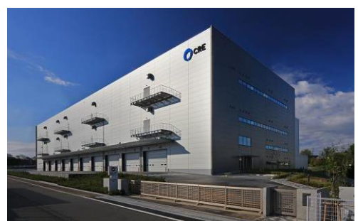
8 ロジスクエア新座 2017年4月竣工