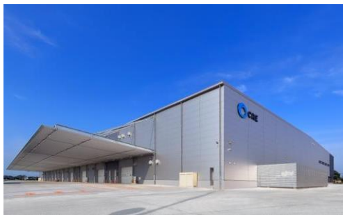
5 ロジスクエア羽生 2016年7月竣工