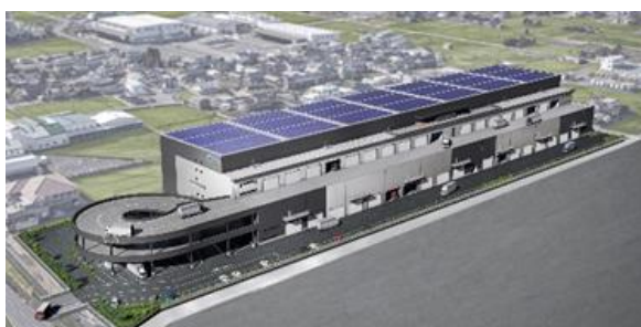
26 ロジスクエアア宮 2023年9月竣工予定