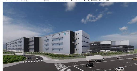
29 ロジスクエアふじみ野 A 2024年1月竣工予定