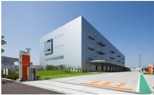
1 ロジスクエア草加 2013年6月竣工