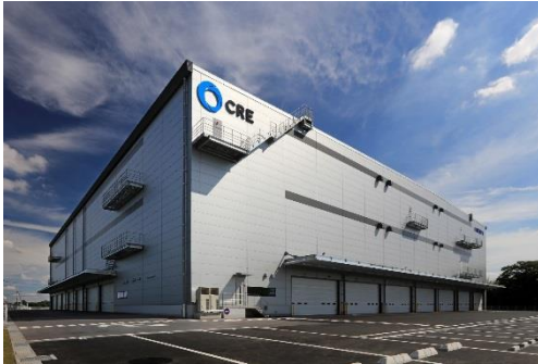
13 ロジスクエア春日部 2018年6月竣工