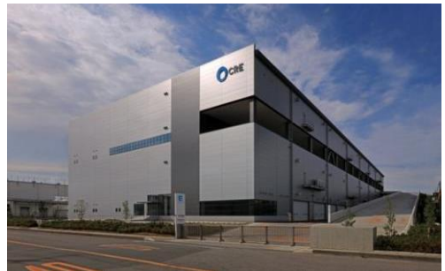
4 ロジスクエア久喜 2016年6月竣工