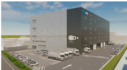
24 ロジスクエア厚木 I 2023年3月竣工予定