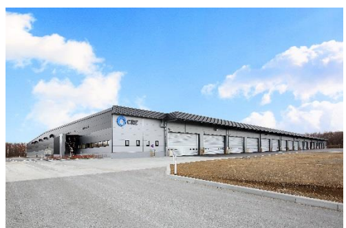
10 ロジスクエア千歳 2017年12月竣工