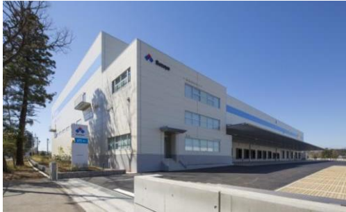
3 ロジスクエア日高 2015年3月竣工