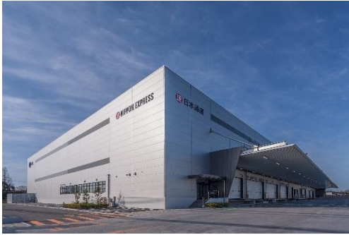
11 ロジスクエア鳥栖 2018年2月竣工