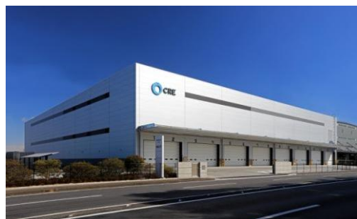
6 ロジスクエア久喜II 2017年2月竣工