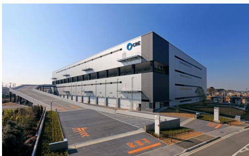
7 ロジスクエア浦和美園 2017年4月竣工