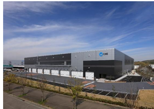
16 ロジスクエア神戸西 2020年4月竣工