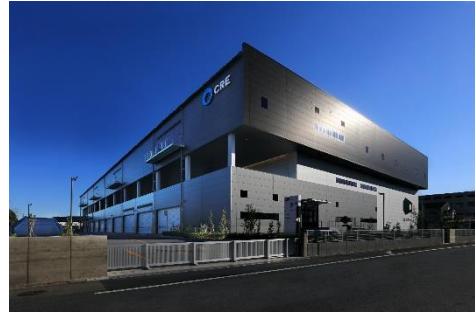
22 ロジスクエア白井 2022年12月竣工