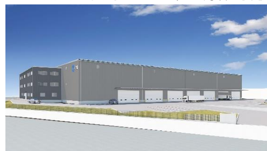
34 ロジスクエア掛川 2024年1月竣工予定