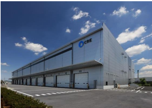
15 ロジスクエア川越Ⅱ 2019年6月竣工