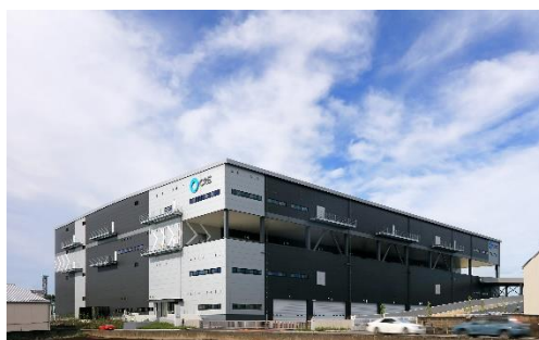
17 ロジスクエア三芳 2020年6月竣工