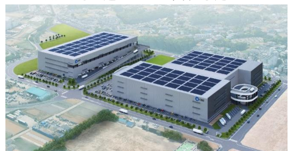
35 ロジスクエア朝霞 A 2026年竣工予定