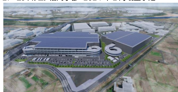
32 ロジスクエア京田辺 A 2025年2月竣工予定