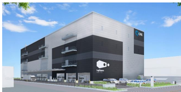
25 ロジスクエア松戸 2023年5月竣工予定