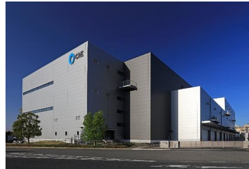
14 ロジスクエア上尾 2019年4月竣工