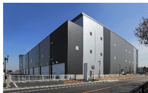
20 ロジスクエア三芳Ⅱ 2021年3月竣工