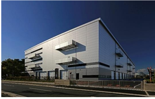
21 ロジスクエア伊丹 2022年11月竣工