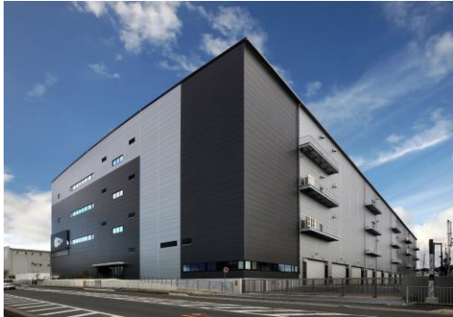
23 ロジスクエア枚方 2023年1月竣工