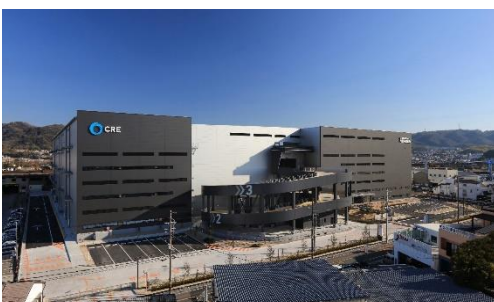
19 ロジスクエア大阪交野 2021年1月竣工