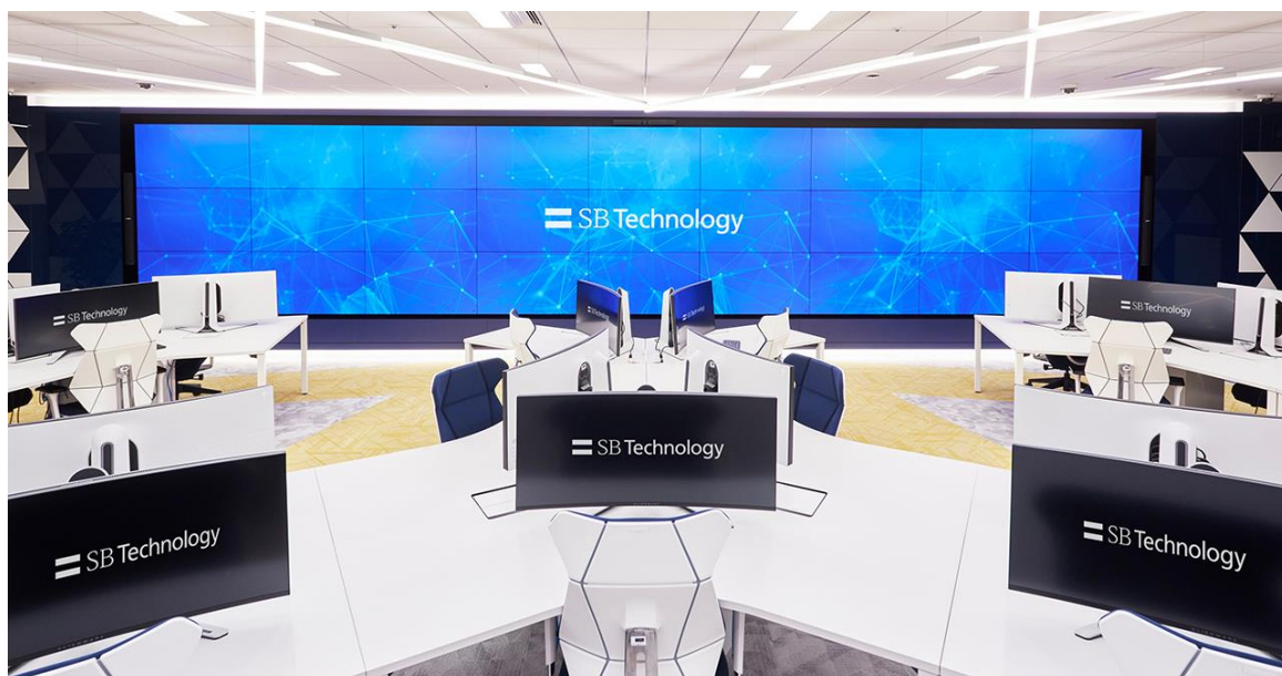
SBTのセキュリティ監視センター (SBT-SOC)