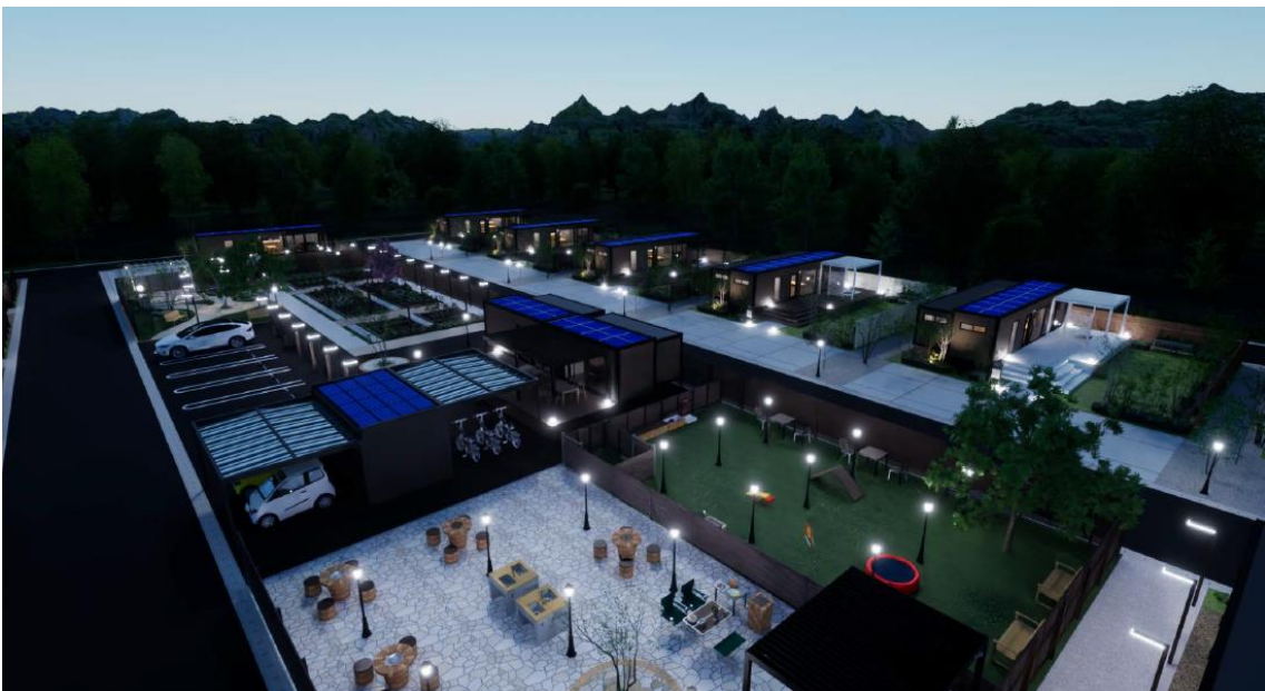
GXヴィレッジイメージ（夜）