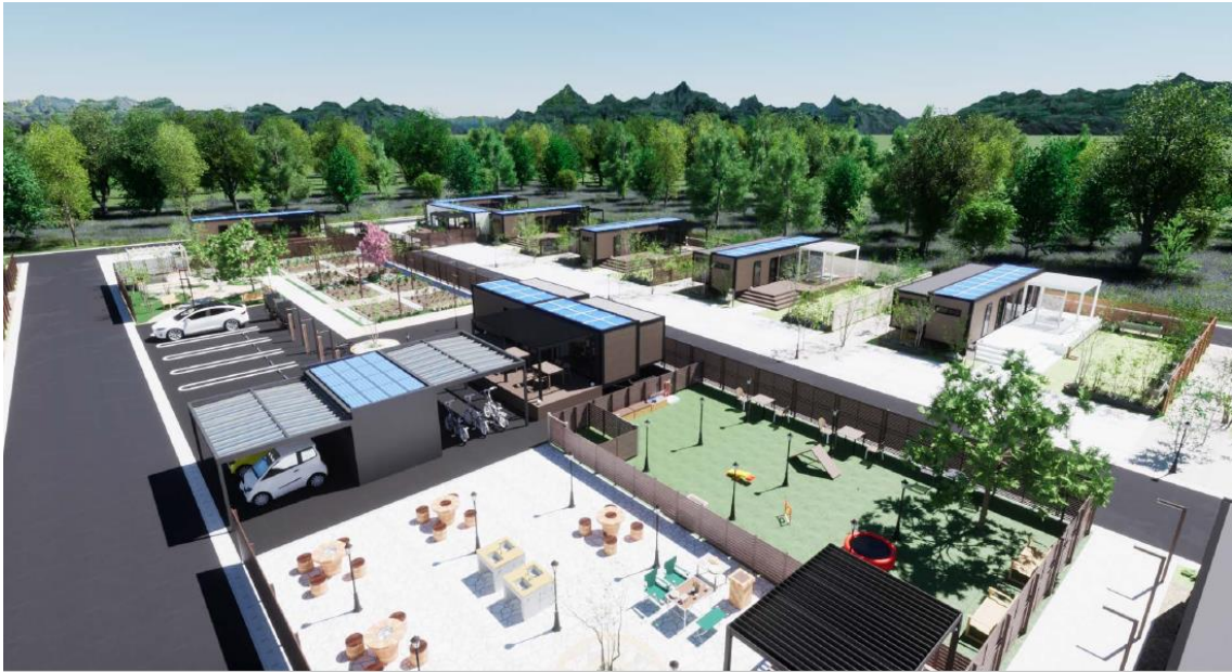
GXヴィレッジイメージ