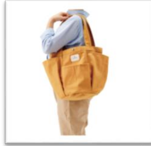
オーガニックコットン ガーデニングバッグ