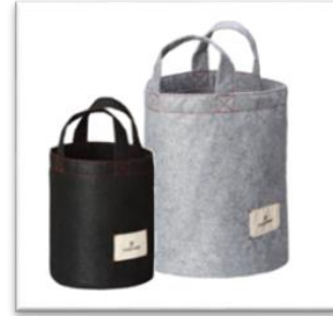
プランターカバー