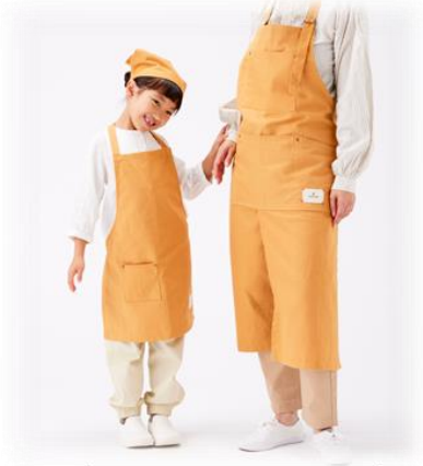
オーガニックコットン ワークエプロン

「F.O.B COOP」の出展ブースでは、環境に配慮した素材を使用し、機能性とデザイン性に優れたガーデニンググッズを展示します。オーガニックコットンや再生 PET を使用した製品を用意しました。