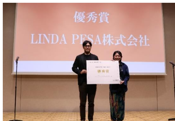
Marui Co-Creation Pitch 受賞式の様子