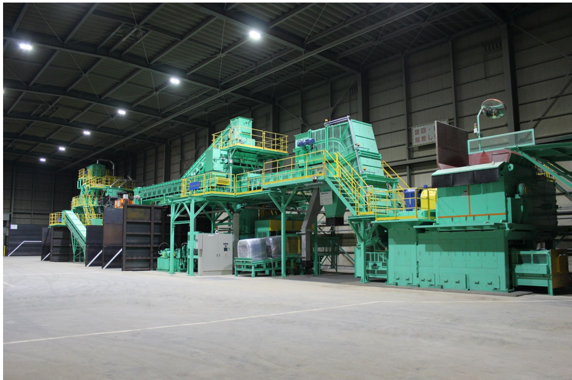
今般導入した選別・破碎設備ライン