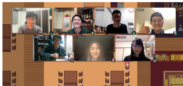
はたらく部での活動の様子