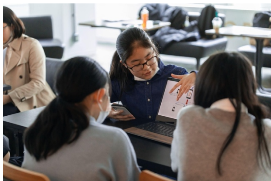
ドルトン東京学園様との起業ゼミの様子

https://www.gaiax.co.jp/startup-seminar/