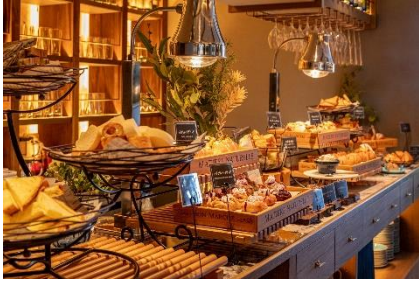
パンビュッフェランチのイメージ