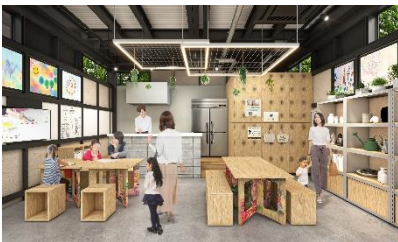
B: コミュニティスペース「LABO」

地域住民、学生、ボランティア、企業などが日常的に共同参画しながら、新しい活動や繋がりを生み出していく「創造の場」として活用します。さらに、パークコミュニケーターが常駐し、公園でやってみたいことやお困りごとなどを聞いて一緒に公園づくりを行います。公園をよりアクティブに楽しむための公園グッズの販売も行います。