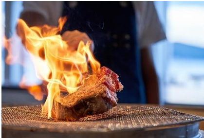
赤身肉の炭火グリルのイメージ