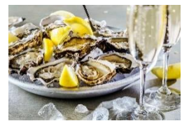
パンビュッフェランチのイメージ