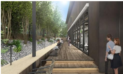
テラスエリアのイメージ