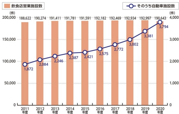
図 1. 東京都の飲食店営業施設数と自動車施設（キッチンカー）数の推移

このようなモビリティならではの特性を活かしたプロモーションサービス「モビキチ」によって、今後も食の新しい価値を提供する企業様をサポートするとともに、料理人や消費者との架け橋となり、食の業界の発展に貢献してまいります。