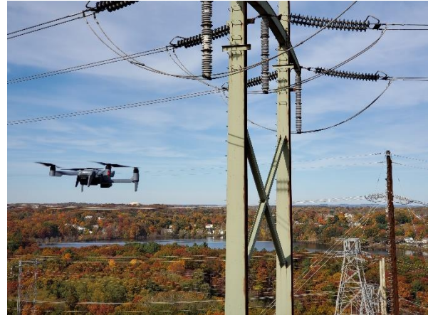
(写真) 顧客先でのロードショー

こうした背景から、ACSLは米国への進出を本格化することを決め、米国子会社 ACSL, Inc. を設立するに至りました。