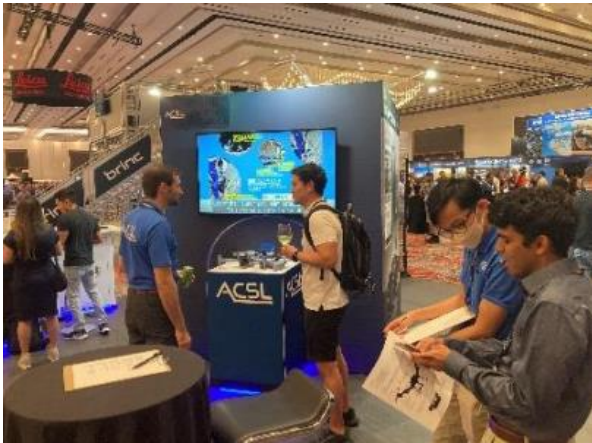
(写真) 2022年9月 米国展示会 Commercial UAV Expo に出展した際の様子

また、米国の展示会においては、SOTENが点検・測量などで活用できると高評価を頂き、2022年10月、2023年1月に複数の顧客先でロードショーを実施し、実務適用が可能という評価とともに、購入希望を確認しました。