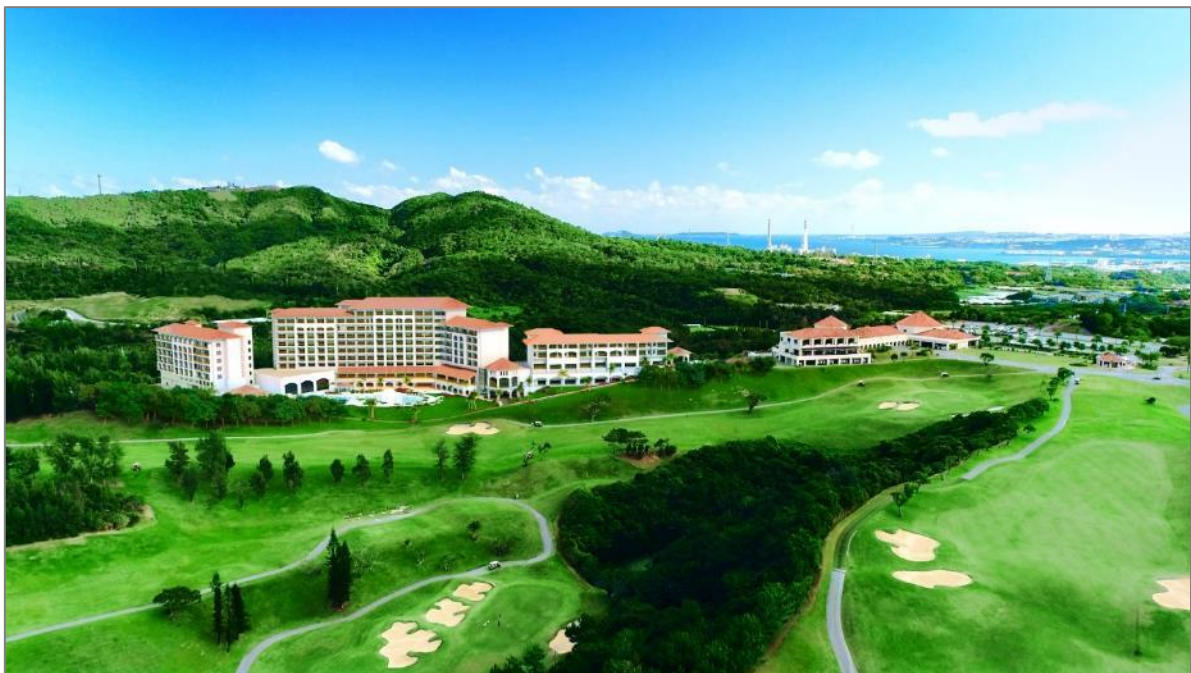
ホテル全景（イメージ）

本ホテルが併設される「PGMゴルフリゾート沖縄」は、2017年に青木 功プロがコースを改造監修して以来、地元沖縄の方から観光客まで、多くのゴルファーに利用されています。本ホテルを開業することにより、ゴルフ場を併設した唯一無二のラグジュアリー総合リゾート施設として、「訪れるたびに新たな感動に出会う楽園」を提供してまいりますので、ぜひご期待ください。