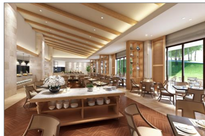
オールデイダイニング