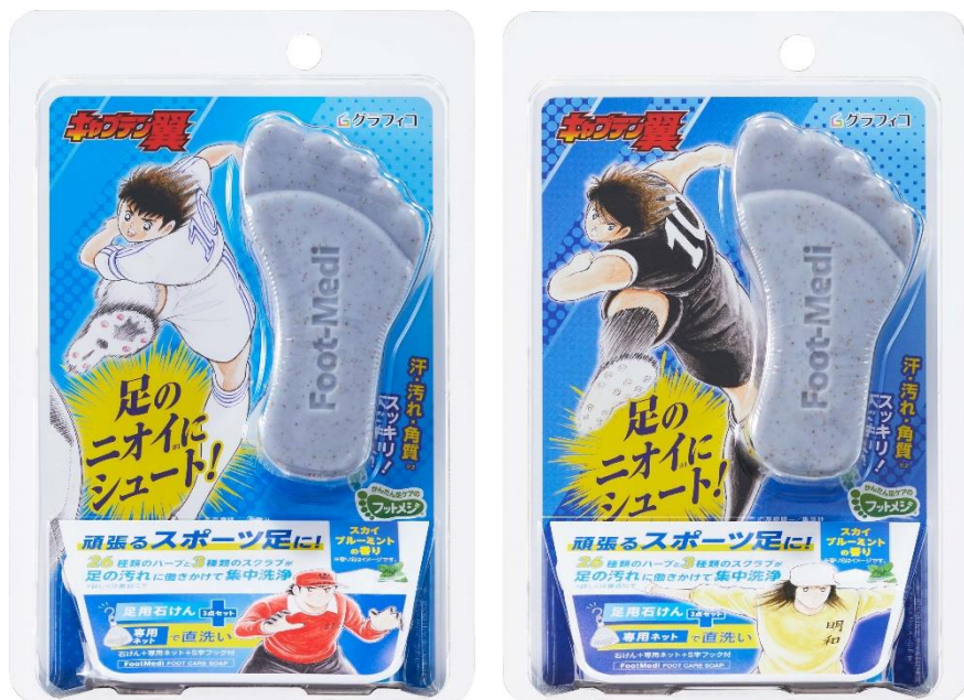
大空翼×若林源三 パッケージ