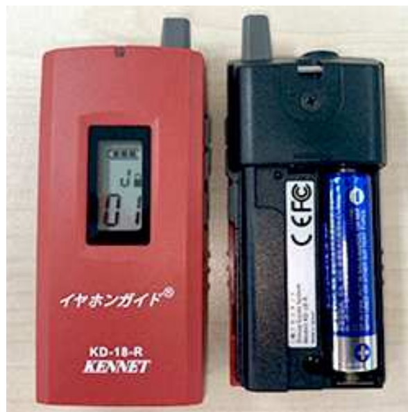
▲イヤホンガイドで使用している単三乾電池

EV市場拡大を背景としたリチウムイオン電池価格の高騰もあり、安価なアルカリ乾電池の利用が見直されていますが、その価格も上昇傾向にあります。昨今、SDGsへの取り組みが注目される中、ケンネットでは事業活動と寄贈活動を通じて、SDGs目標達成に向けて取り組んでまいります。