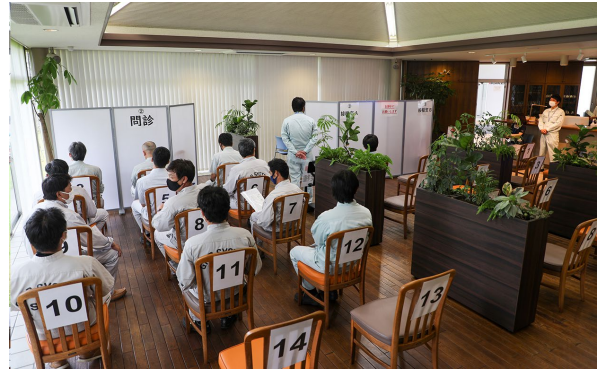
新型コロナウイルスワクチン接種会場の様子 （技研製作所高知本社）