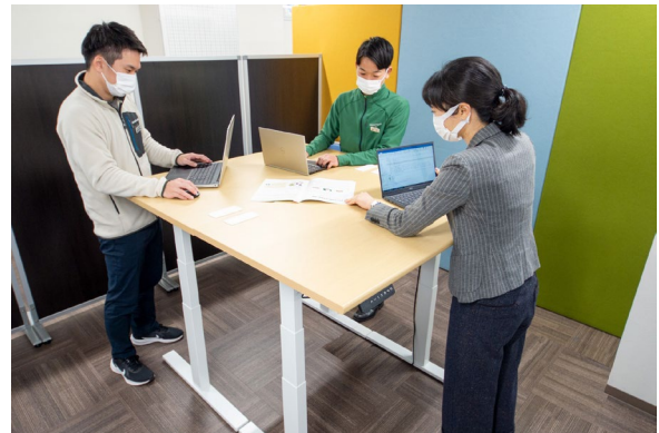
スタンディングデスクの導入 （技研施工高知本社）