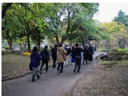
会社主催ウォーキングイベント

新たな取り組みとして会社主催のウォーキングイベントや、歩行基礎力測定会の開催など、社員の健康増進を後押しする施策を行いました。