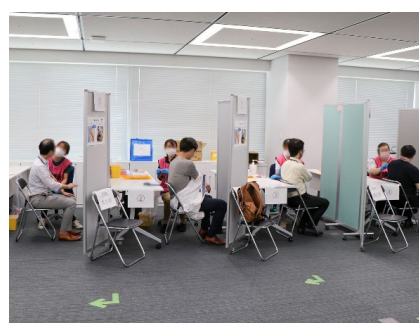
社内集団接種会場

新型コロナ対策として引き続き社員の感染予防・感染拡大防止策に取り組み、オンライン会議や在宅勤務推奨を積極的に行っています。また、インフルエンザワクチン接種も集団接種や費用補助を行っています。