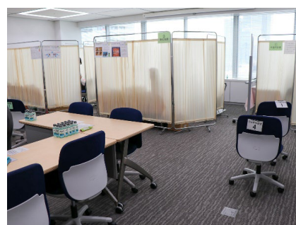
職場内で実施した歯科検診

J F E 健康保険組合の協力により、様々な健康施策を実施しています。専門医によるオンラインセミナーの開催や、歯科検診、乳がん自己検診グッズや歯科衛生用品の配布などセルフケアの推進や啓発を行っています。