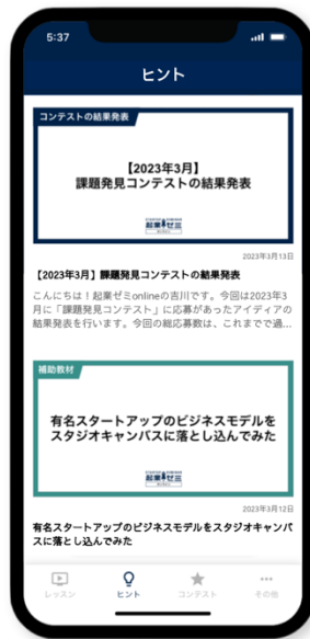
ヒント機能【気づく】