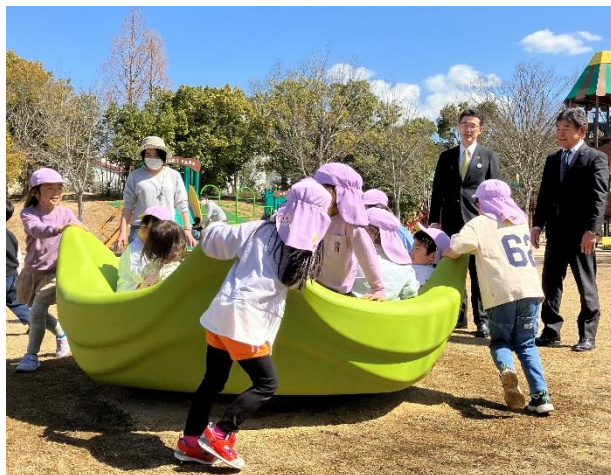
インクルーシブ遊具で遊ぶ園児の様子