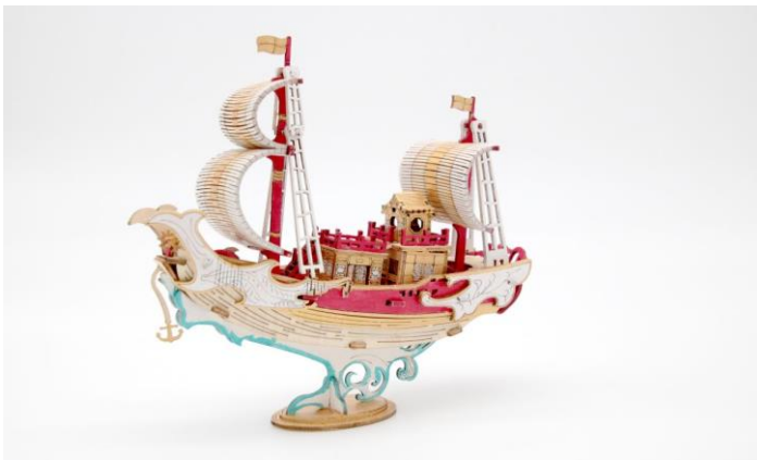
絵の具でアレンジされた宝船

ウッドパズルは着色されていないので、絵の具などで自分好みにアレンジができることも魅力的です。また、船シリーズは、木工用ワックスなどでアンティーク風に仕上げるとより味わいのあるウッドパズルに仕上がります。もちろん、木の素材をそのまま活かしても、あたたかみのある優しい雰囲気を楽しめます。