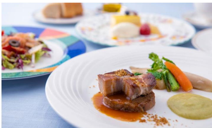
A 賞：クルーズディナー（※商品の写真はイメージとなります。）