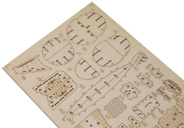
カット済みのウッドシート

DIY クラフトキット「つくるんです®」の 3D ウッドパズルは、工具・接着剤なしで組み立てることができます。カット済みのウッドシートから、ひとつずつパーツを外していき、説明書に沿って組み立てていけばクオリティの高い 3D ウッドパズルが出来ます。特別な道具を準備する必要がなく、手軽に作り始められるので初めて挑戦する方にもおすすめです。