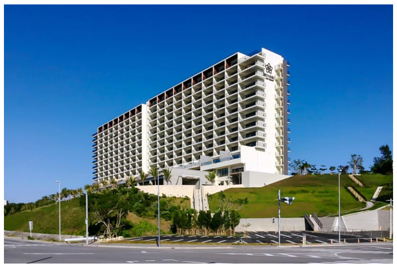
高台に立地する「HIYORI オーシャンリゾート沖縄」