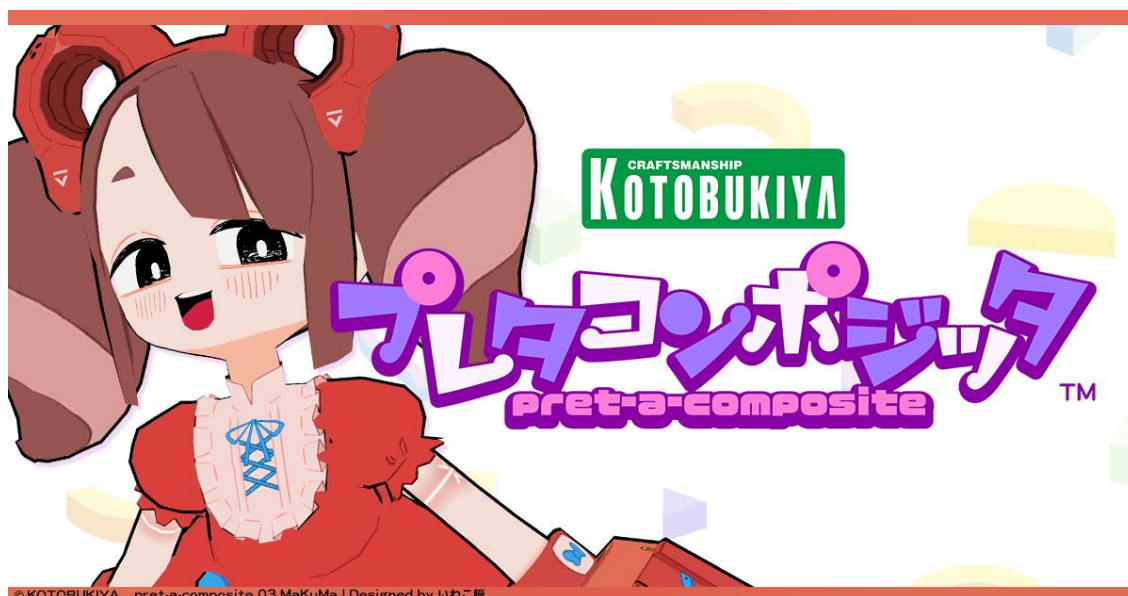
プレタコンポジッタ 03 マクマ

この度、株式会社壽屋（本社：東京都立川市／代表取締役社長：清水一行）はオリジナル 3D モデルブランド「プレタコンポジッタ」シリーズ第3弾、MaKuMaを2023年3月23日（木）に発売いたします。