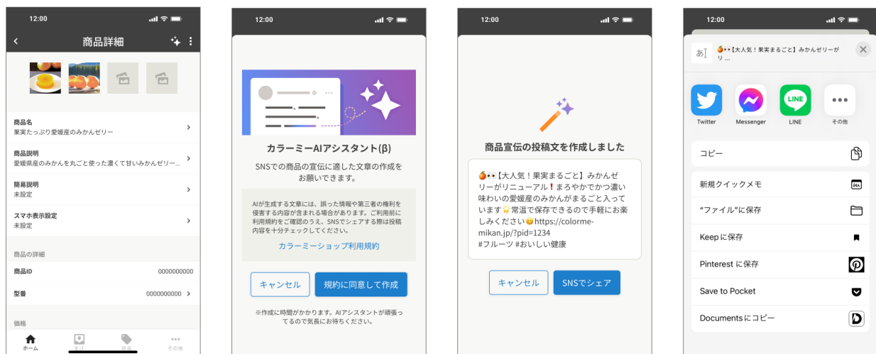
▲『カラーミーAIアシスタント(β)』画面イメージ

本機能は、「カラーミーショップ byGMOペパボ」のiOSアプリ上の商品設定の画面より『カラーミーAIアシスタント(β)』のアイコンをタップするだけで、最短10秒程度でユーザーが登録している商品情報をもとにAIがSNS投稿用の宣伝文を作成します。また、最適なキーワードやハッシュタグ・絵文字を含んだ文章が生成されるため、ユーザーはより効果的な投稿を行えるだけでなく、SNS投稿のためのリサーチ時間も削減できます。