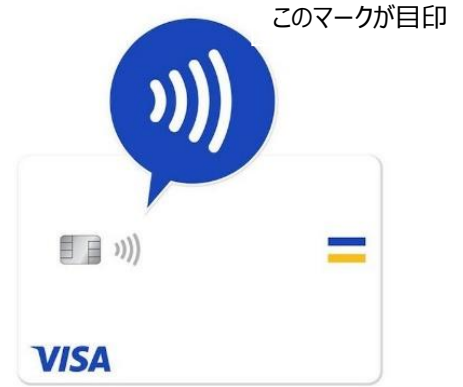
Visa タッチ決済機器 (イメージ)