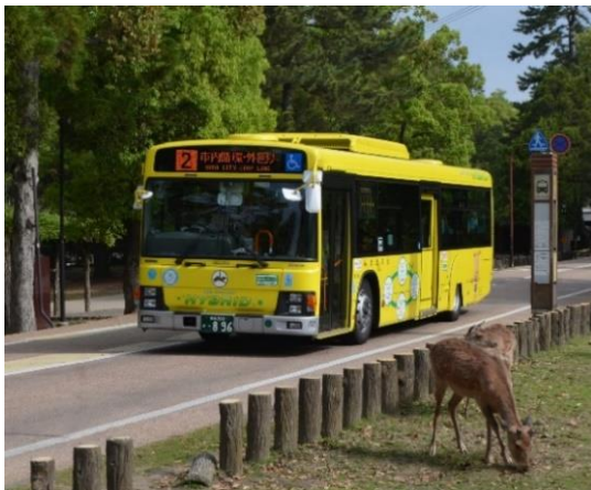
奈良市内循環線イメージ