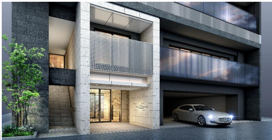
エントランス完成予想図 (※9)