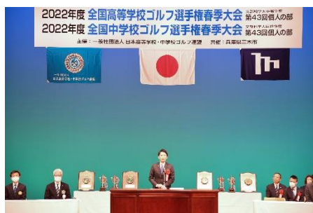
↑兵庫県知事 齋藤元彦氏によるご挨拶の様子