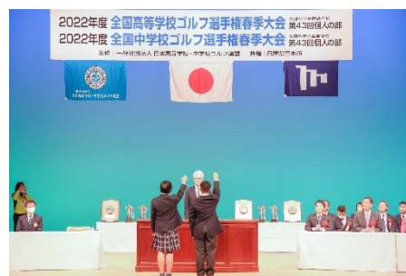
↑選手宣誓時の様子

当日はギャラリー観戦も可能となっております。出場選手の応援をよろしくお願いいたします!