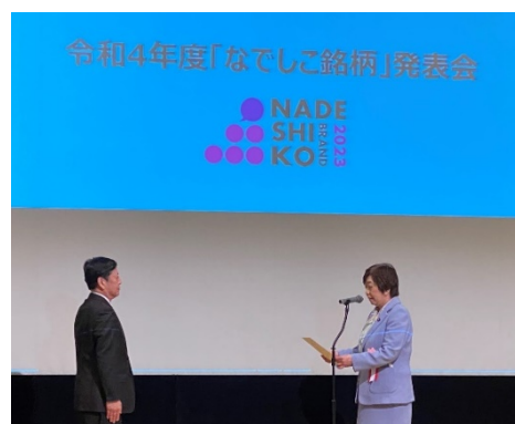
選定証授与の様子