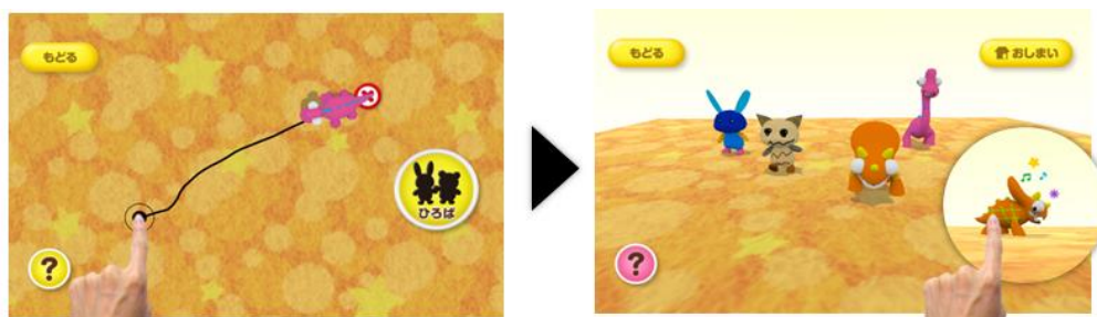
自分が塗ったキャラクターを自由に動かせる!