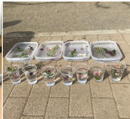
【各園での実験の様子】

さらに、1 月 30 日(月)には参加園をオンラインでつないだ発表会を実施しました。北海道の園は気温がマイナス 12 度で、一晩外に置いたらカチコチに凍ってしまった水を絞ったタオルを見て、こどもたちはビックリ。地域によって気温や気候、凍り方が違うことに驚いていました。