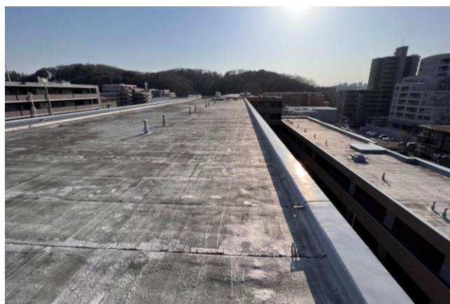
太陽光発電設備導入予定の屋上