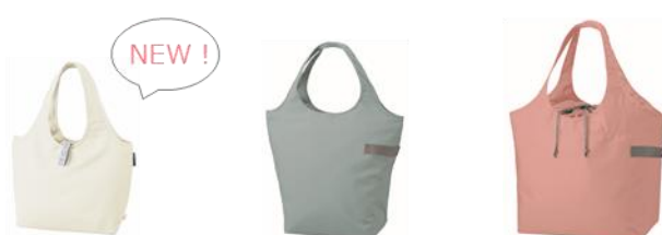
ミニマルシェバッグ