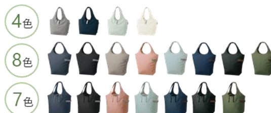
ビッグマルシェバッグ