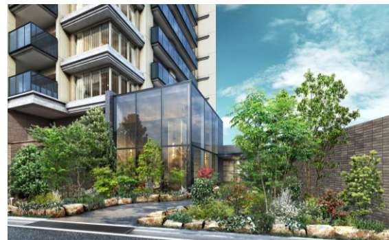
エントランスアプローチ完成予想図