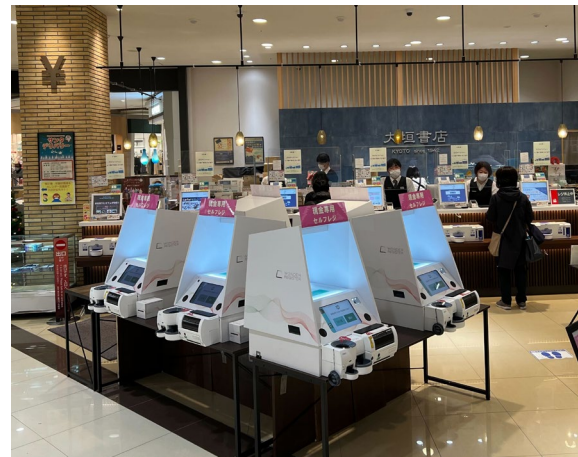
大垣書店 イオンモール京都桂川店(京都府京都市)