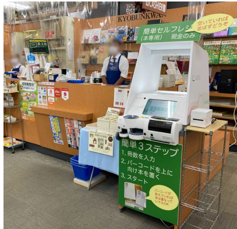
教文館(東京都中央区)