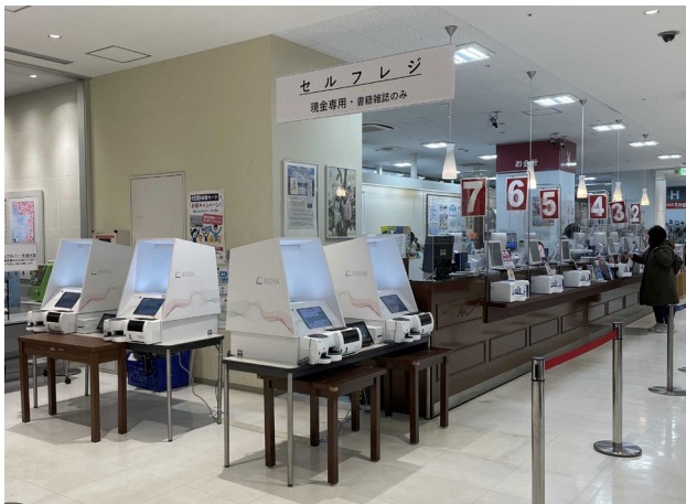
大垣書店 イオンモールKYOTO店(京都府京都市)