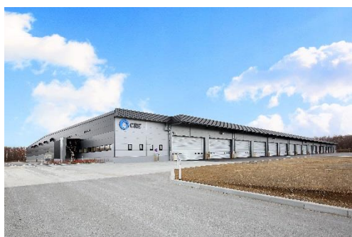
10 ロジスクエア千歳 2017年12月竣工