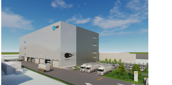
28 ロジスクエア厚木Ⅱ 2024年3月竣工予定