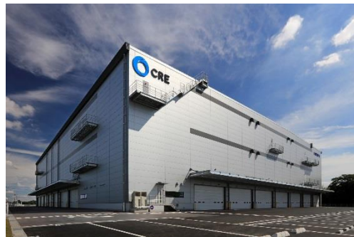
13 ロジスクエア春日部 2018年6月竣工