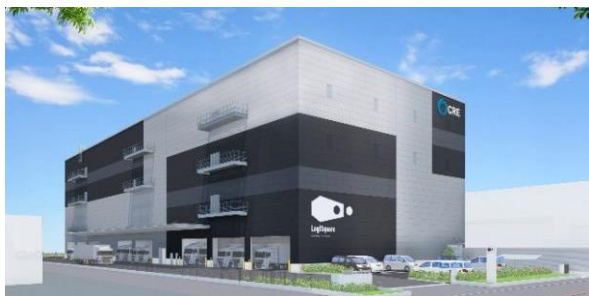
25 ロジスクエア松戸 2023年5月竣工予定