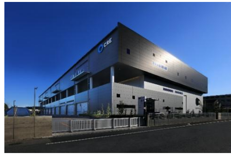
22 ロジスクエア白井 2022年12月竣工