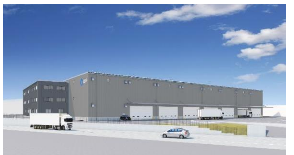
34 ロジスクエア掛川 2024年1月竣工予定