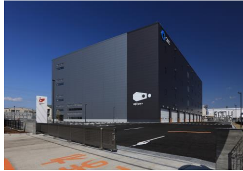
24 ロジスクエア厚木I 2023年3月竣工