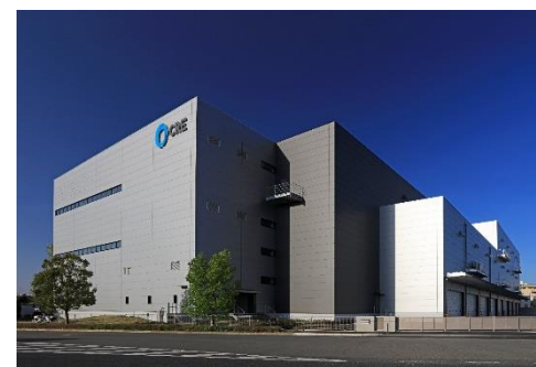
14 ロジスクエア上尾 2019年4月竣工