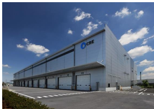
15 ロジスクエア川越Ⅱ 2019年6月竣工