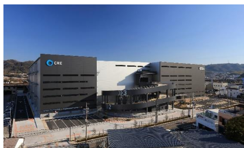
19 ロジスクエア大阪交野 2021年1月竣工