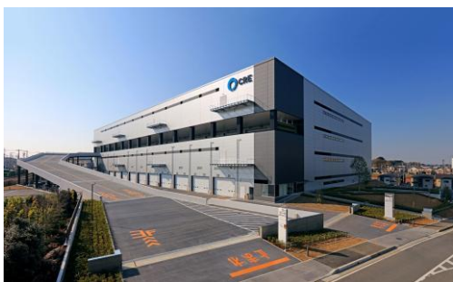
7 ロジスクエア浦和美園 2017年4月竣工