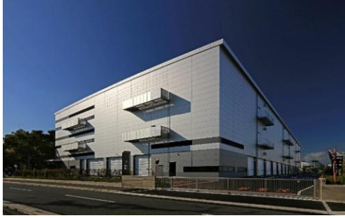
21 ロジスクエア伊丹 2022年11月竣工