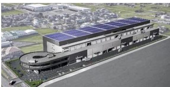
26 ロジスクエア一宮 2023年9月竣工予定