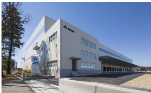
3 ロジスクエア日高 2015年3月竣工