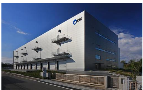
8 ロジスクエア新座 2017年4月竣工