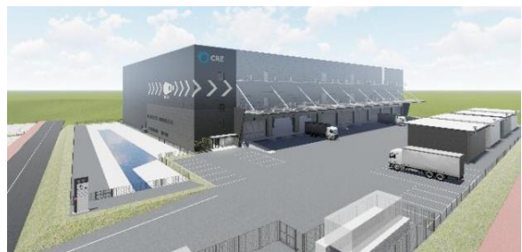
27 ロジスクエア福岡小郡 2024年2月竣工予定