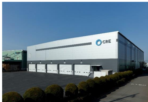
12 ロジスクエア川越 2018年2月竣工