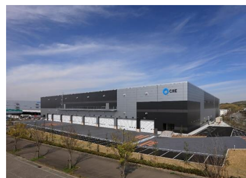
16 ロジスクエア神戸西 2020年4月竣工