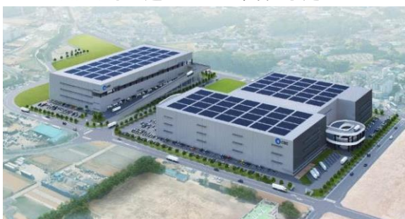
35 ロジスクエア朝霞 A 2026年竣工予定 36 ロジスクエア朝霞 B 2026年竣工予定 ※パースはイメージであり、今後変更となる可能性がございます。