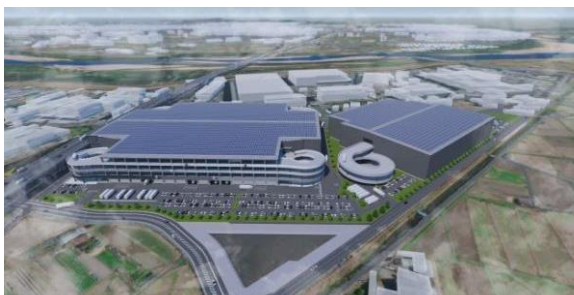
32 ロジスクエア京田辺 A 2025年2月竣工予定 33 ロジスクエア京田辺 B 2026年竣工予定