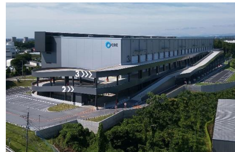
18 ロジスクエア狭山日高 2020年6月竣工