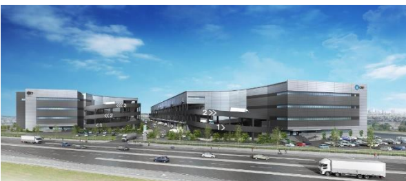
29 ロジスクエアふじみ野 A 2024年1月竣工予定 30 ロジスクエアふじみ野 B 2024年10月竣工予定