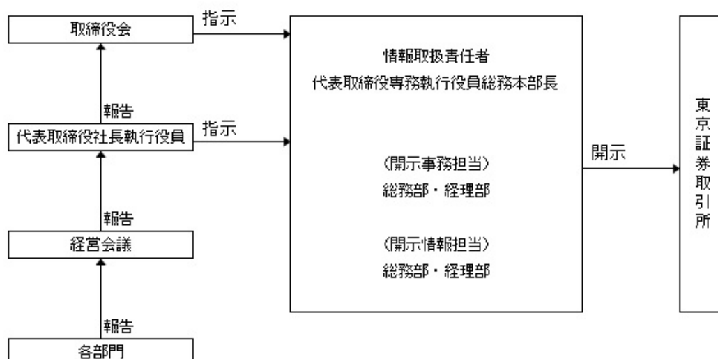
【別紙】スキルマトリックス