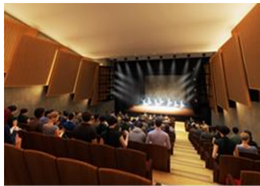
メニコン シアターAoi