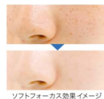
ソフトフォーカス効果イメージ

どんな肌の色にもなじみやすいブライトアップヌードカラー。毛穴やシミをぼかすことでカバーし、トーンアップ。みずみずしく軽い、のびのよいテクスチャーです。