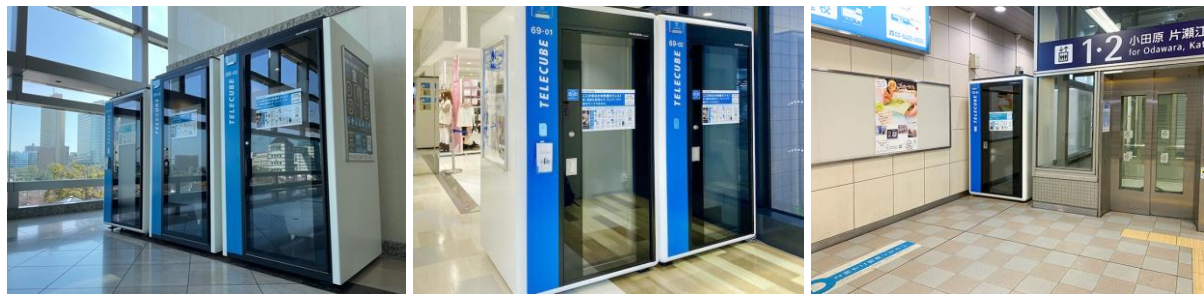
公共空間に設置している防音個室ブース「テレキューブ」

「AD テレキューブ」はテレキューブへのラッピング広告掲載、「チャンネル テレキューブ」はテレキューブ室内での商品体験・サンプリングを可能にするプランです。これにより、従来の「いつでもどこでも使えるワークブース」というビジネス用途に加え、カウンセリングやリラクゼーション、美容・健康など幅広い用途への新たな価値提供を進めてまいります。