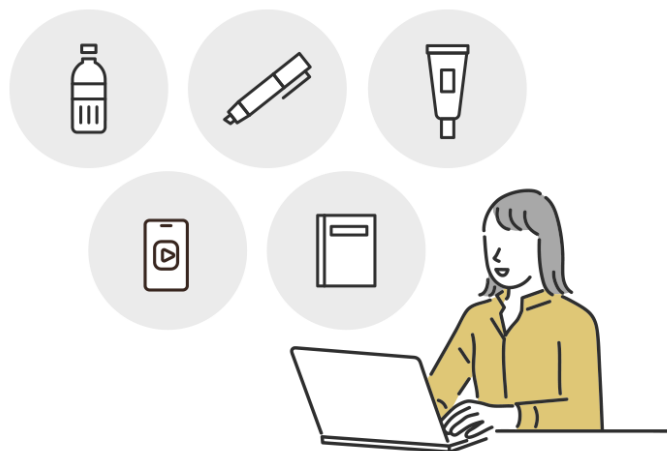
テレキューブとのコラボレーションのイメージ

いております。その中で、これまで「めぐリズム」(花王様)や「ブランディアBell」(デファクトスタンダード様)など様々な商品・サービスと連携し、新たな用途での価値づくりを進めてまいりました。