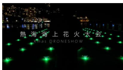
熱海会場花火大会での演出

また、石川県発のスタートアップ企業として、地方創生に向けた取り組みも積極的に行っています。