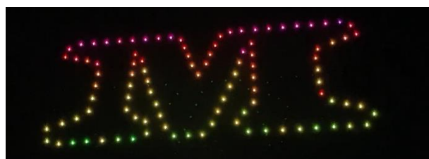
M-1 グランプリでのオープニング演出

ドローンショーは、ソフトウェアエンジニアの他、ハードウェアエンジニアも自社で雇用しており、機体の製造・メンテナンス・修理を、自社内で一気通貫して提供することが可能です。今後は、軽量さと堅牢性と共に、長時間安定飛行可能、かつ演出上の仕様が強化された、競争優位性の高い機体開発を行う予定です。加えて、アニメーション制作を自社で手掛けることで、より表現力の高い演出を可能にしています。