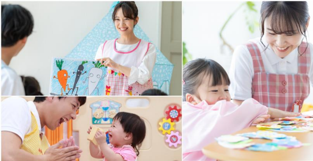
職員が安心して仕事にまっすぐに向き合える環境づくりを大切に事業展開を行っています。

(はなホールディングス: https://hd.hanahoiku.co.jp/ )