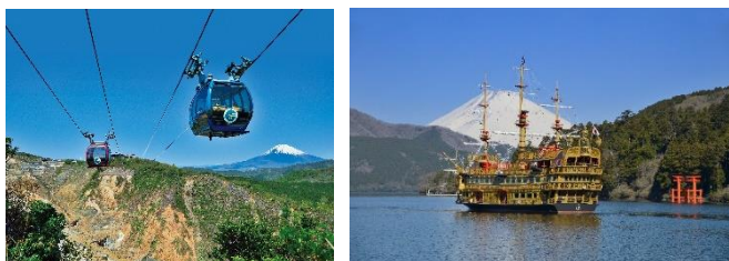
国際ブランドのタッチ決済を導入する 箱根ロープウェイ・箱根海賊船